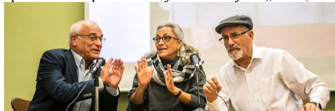
Izraelští účastníci semináře Pesach a Večeře Páně

Z témat, ze kterých nekorektní humor čerpá, jsou však (hlavně v poslední době) ta „rasistická“ nejpálčivější. Píší záměrně uvozovky, i když je to pro mnohé z nás oficiální název této kategorie vtípu, a proto jej tak i běžně používáme – ale je toto označení skutečně správné? Wikipedie definuje rasismus jako „názor, že z