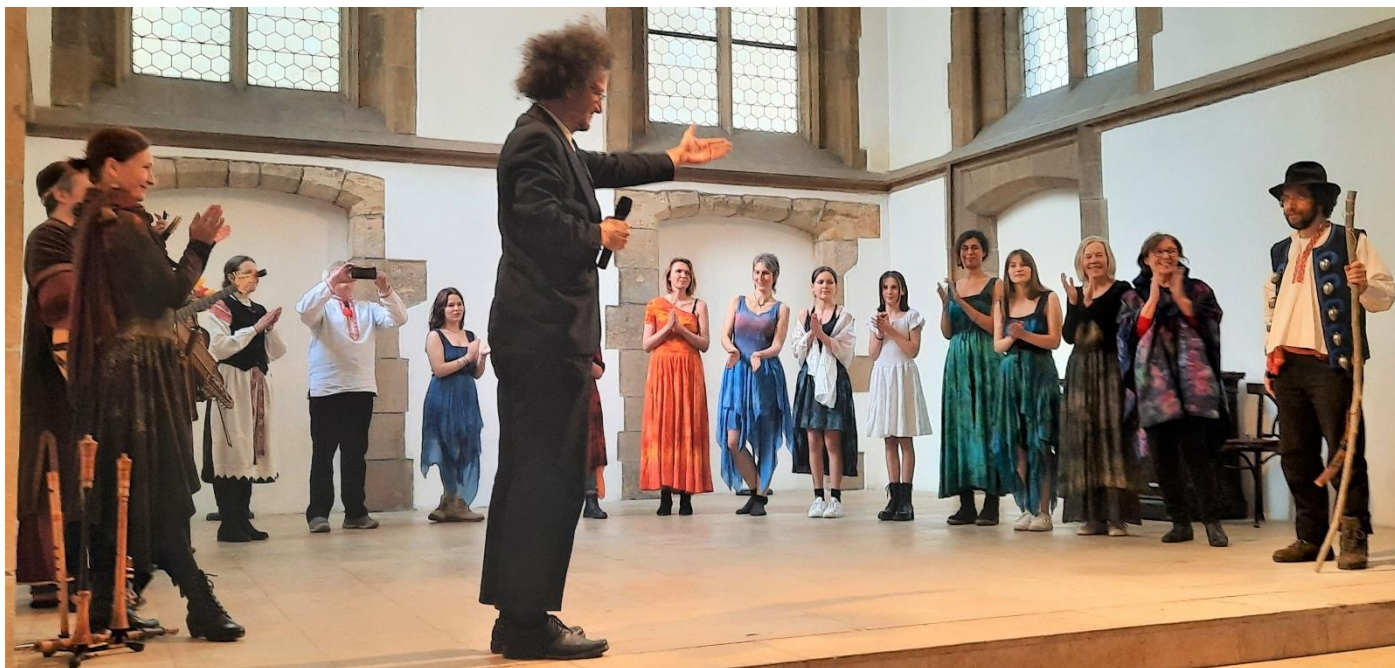
Módní přehlídka proti rasismu