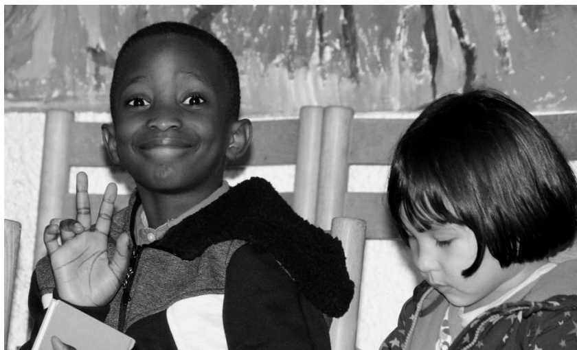
Účastníci multikulturního festivalu Stánek míru