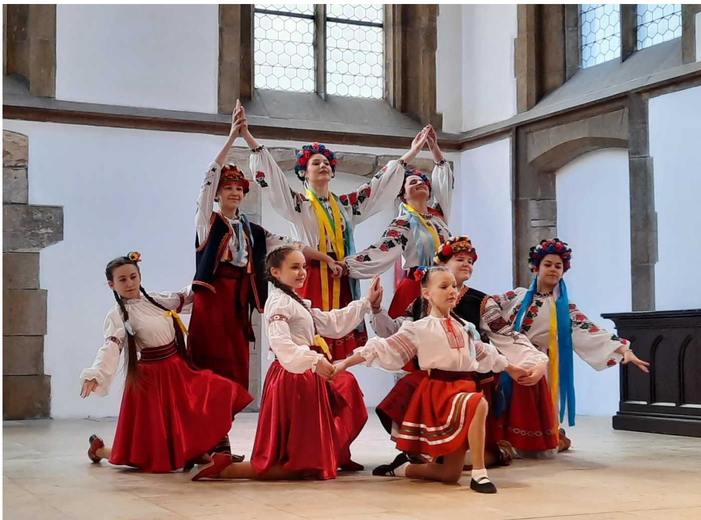
Módní přehlídka proti rasismu U Martina ve zdi – ukrajinský soubor Džerelo