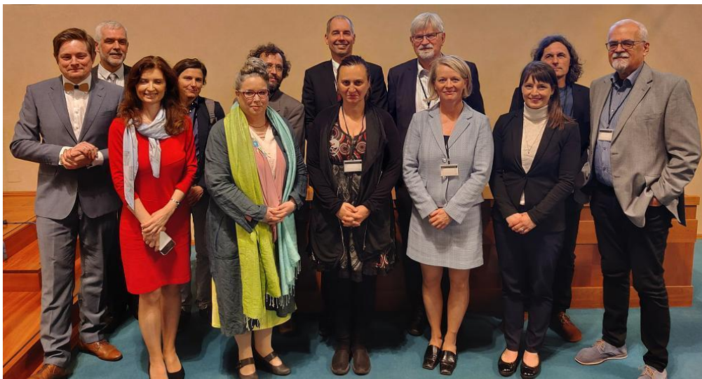
Pořadatelé a přednášející na semináři