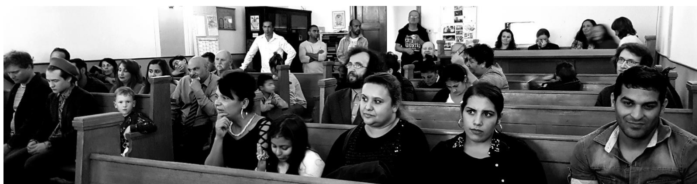
Bohoslužba v Berouně