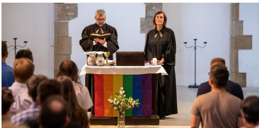
Bohoslužba sdružení LOGOS v kostele U Martina ve zdi