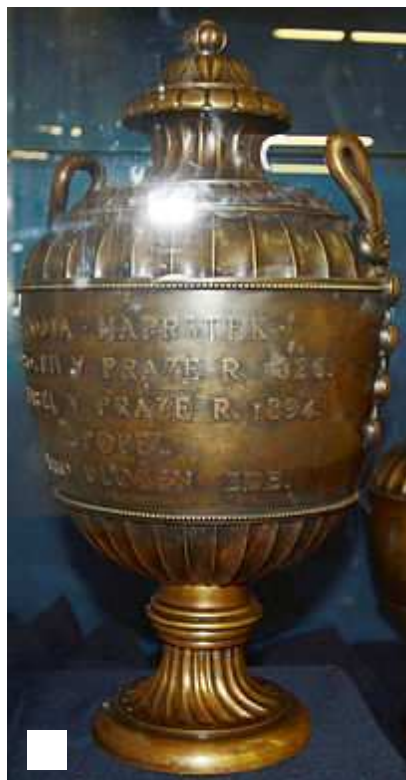
Urna Vojty Náprstka uložená v Náprstkově muzeu.