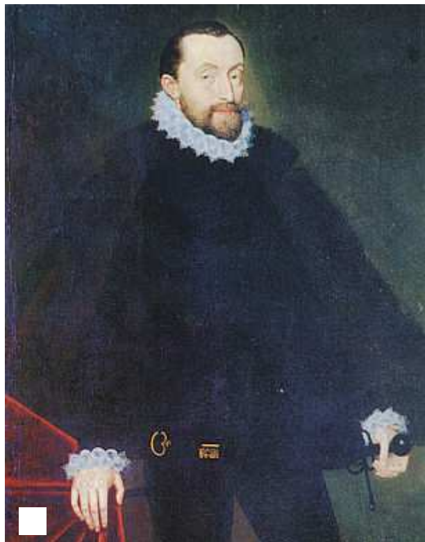
Petr Vok měl okázalý pohřeb.