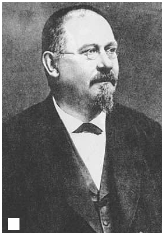
Vojta Náprstek prosazoval zpopelnění.