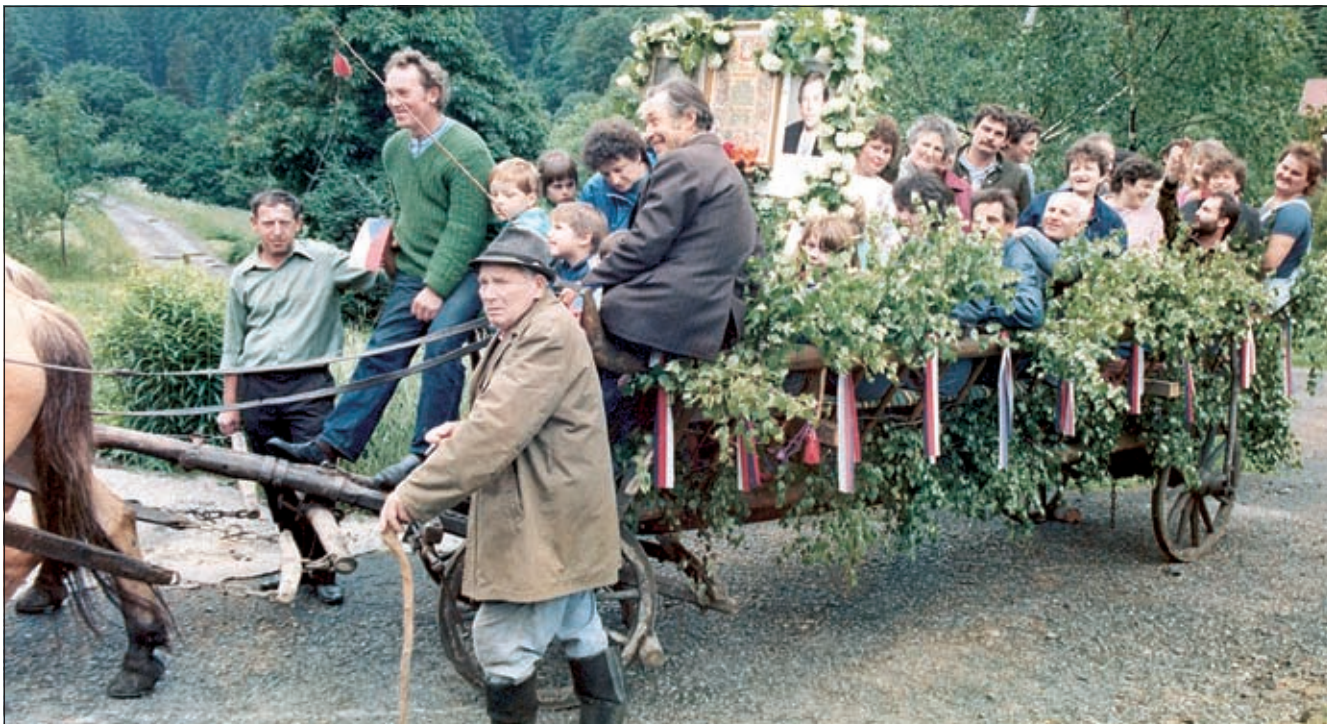
Občané z Háje jedou k prvním demokratickým volbám v roce 1990.