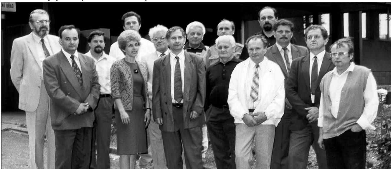
Obecní zastupitelstvo ve volebním období 1990–94.