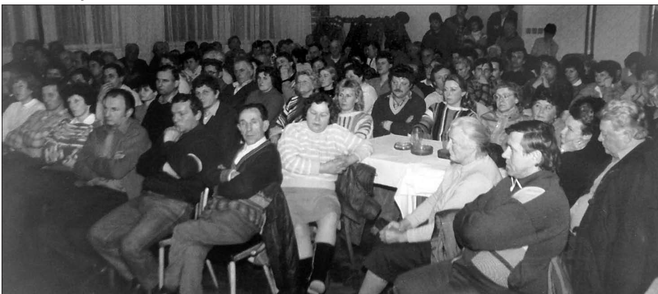
První veřejná schůze Občanského fóra 5. ledna 1990 v sále U Klesků.