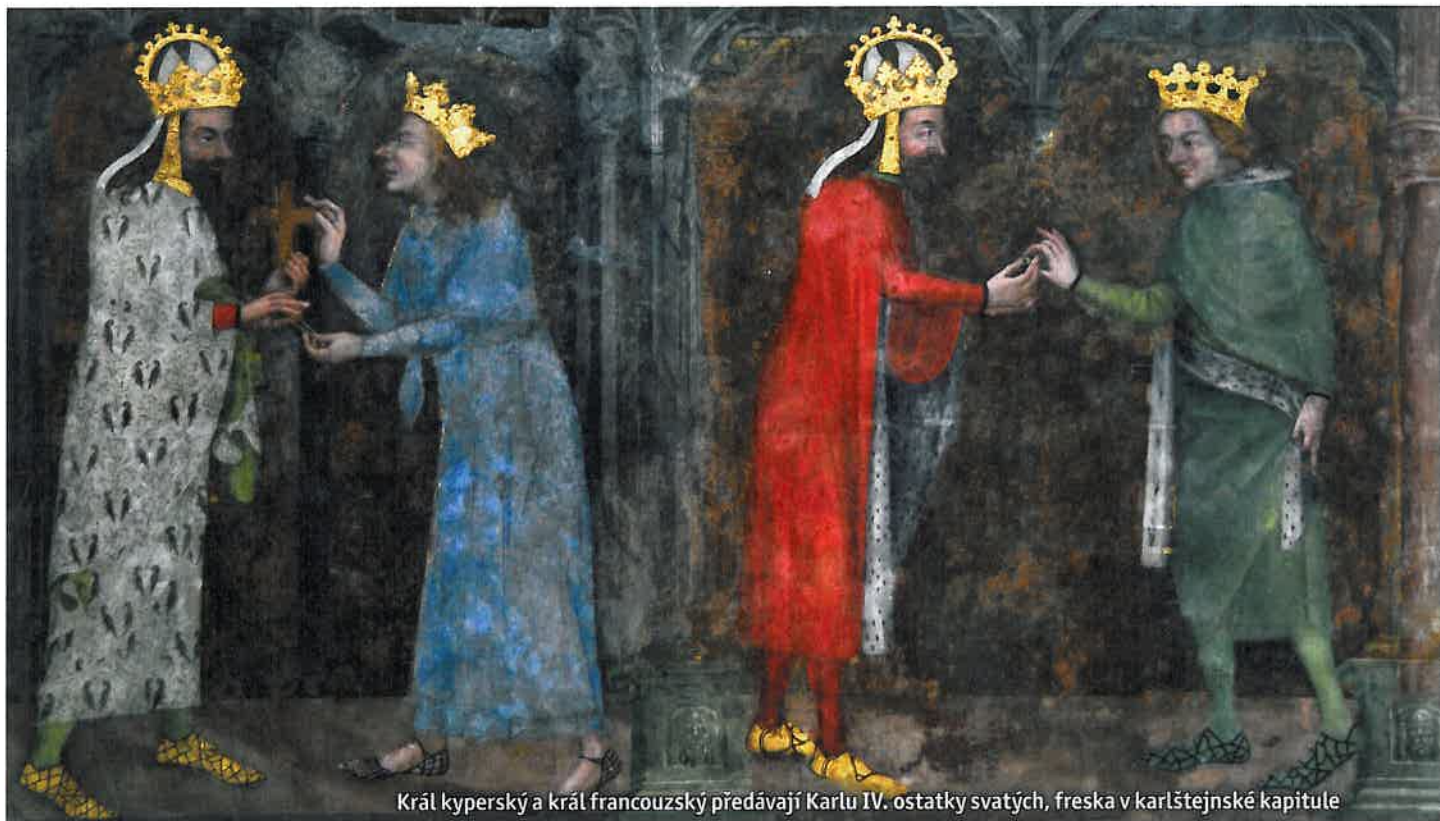
Král kyperský a král francouzský předávají Karlu IV. ostatky svatých, freska v karlštejnské kapitule

se měla starat nejen o duchovní život na hradě, ale také pečovat o říšský poklad a ostatky svatých, které Karel na Karlštejn soustředil. Na stěnách je vymalován příběh apokalypsy.