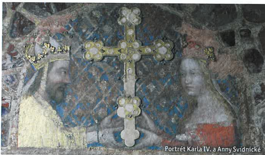
Portrét Karla IV. a Anny Svidnické