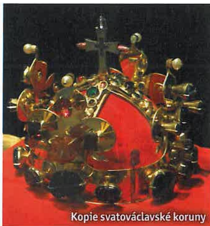
Kopie svatováclavské koruny

Byl ale obklopen lidmi, kteří mu pomáhali. Jeho první družinu mu vybral ještě otec. Byli tam šlechtici z říše, Lucemburska i Čech, kteří už dříve byli na Janově dvoře. S řadou z nich si Karel dobře porozuměl. Později si už Karel sám vybíral mezi šlechtici ty, kteří mu byli nejbližší. Byli to většinou příslušníci drobnější šlechty. V říšské politice mu pomáhali preláti - biskupové a arcibiskupové. Karel se snažil obcházet oficiální postup a doporučovat takové lidi, kteří mu budou věrní, aby jejich prostřednictvím mohl spravovat další území. Ty lidi, které pustil blízko k sobě a kteří vykonávali důvěrné nebo delikátní posláná, si dokázal dobře vybrat. ■