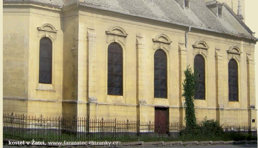
kostel v Žatci