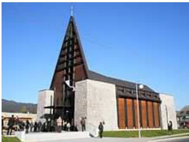
Zájezd 18.10.2015: Evangelický kostel, Písek u Jablunkova

Z dnešních bohoslužeb je pořízen zvukový záznam a bude zveřejněn na webových stránkách.